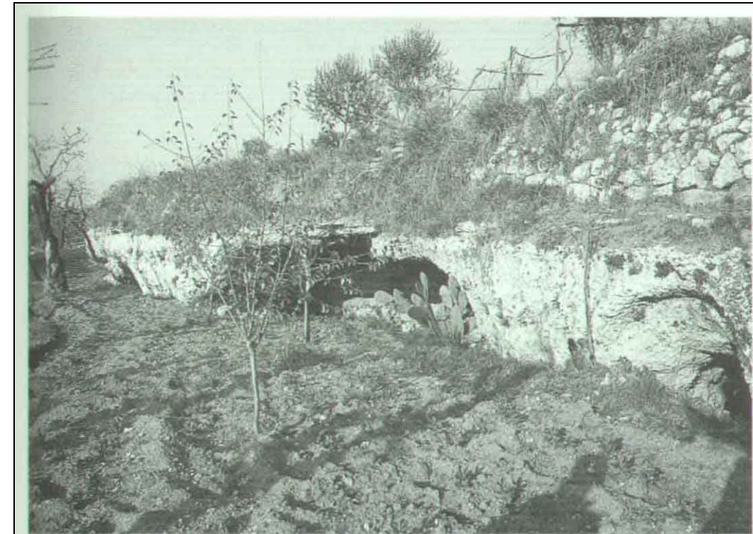
Fig. 5 - Serie di grotte, in località Britti, scavate nella calcarenite ("tufo calcareo").

A tale riguardo, si ricordano gli eventi alluvionali più recenti, del 1.10.1974 e del 10.1.1984, con le strade trasformate in piccoli torrenti in piena, numerosi casi di allagamento di civili abitazioni e di danni alle colture.