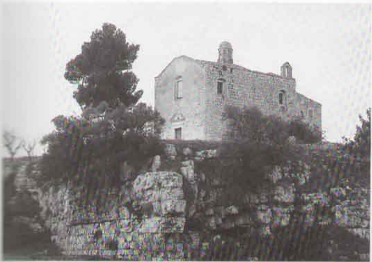
Fig. 3 - L'agglomerato di roccia calcarea su cui sorge la Chiesa dell'Annunziata. Localmente, gli strati calcarei affiorano su entrambe le sponde della loma; altrove, sottostanno ad estive coperture di depositi calcarenitici o sabbioso-argillosi.