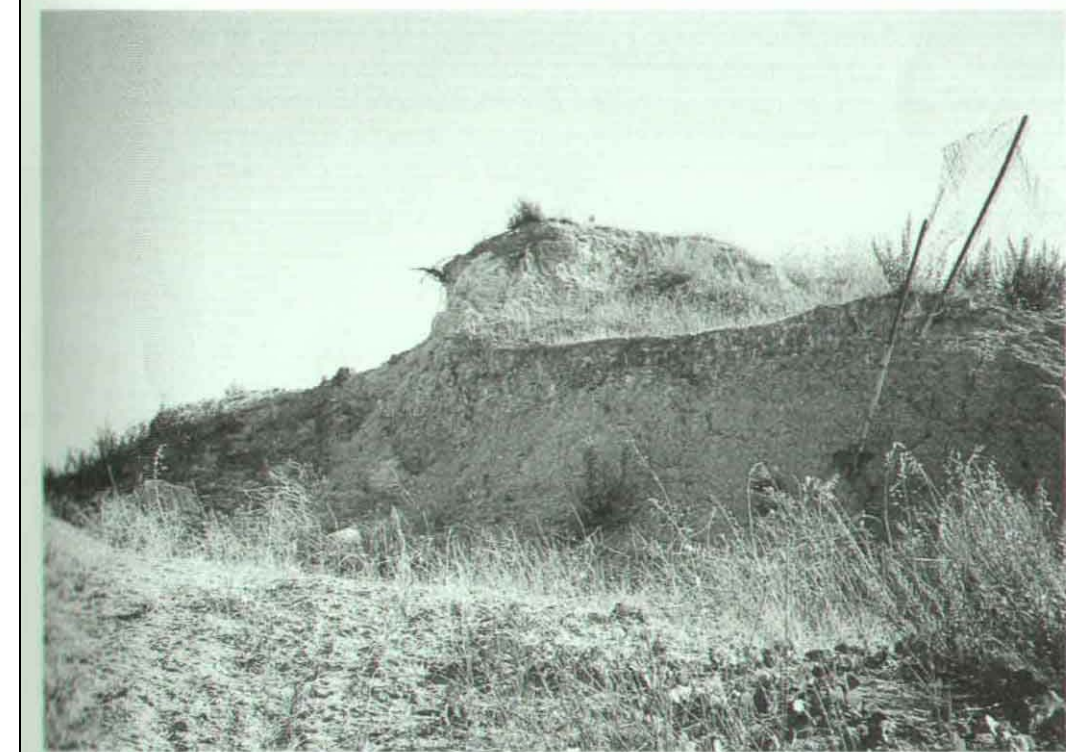
Fig. 6 - Tipico aspetto delle argille grigio-verdi utilizzate per la produzione delle ceramiche di Rutigliano ed estratte in località Pozzillo.