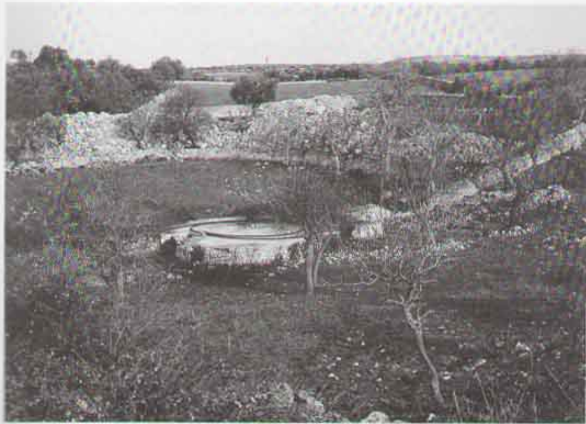
Fig. 2 - Tipico aspetto di un bucino carsico chiuso delle Murge, con al fondo una cisterna per la raccolta delle acque di pioggia.